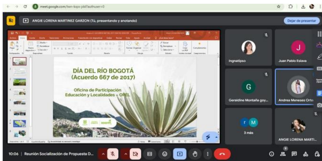
Socialización Propuestas Distritales del Acuerdo 667 del 2017 al MADS y Contraloría. Fecha: 17/03/2025.

Descripción general del espacio: En este espacio, se socializa parte de las propuestas distritales en el marco del Acuerdo 667 del 2017 y se menciona que teniendo en cuenta la opinión de la Agenda Ciudadana en los espacios con Contraloría y Veeduría ciudadana, de evaluar acciones preliminares al Día del Río Bogotá, se propone desarrollar unos procesos de participación en las 5 localidades del Distrito que colindan con el Río Bogotá (Bosa, Suba, Engativá, Kennedy, y Fontibón), con el objetivo de promover la apropiación de la cuenca hidrográfica del río Bogotá en acciones conjuntas y articuladas previo a la conmemoración del Día del Río Bogotá, para que no se quede sólo en la acción del evento central. Por ello, se propone evaluar el apoyo de las entidades regionales y nacionales para la gestión y movilización de recursos como transporte para recorridos, refrigerios, detalles entre otros. Por consiguiente, Contraloría acepta apoyar los espacios de intervención dentro de sus competencias como sensibilizar en la memoria histórica y menciona que dependiendo las otras propuestas que se vayan generando y concertando con las demás entidades nacionales y regionales como CAR, Gobernación Cundinamarca entre otros, se espera seguir fortaleciendo la iniciativa distrital. El MADS menciona que se estaría evaluando internamente la propuesta.